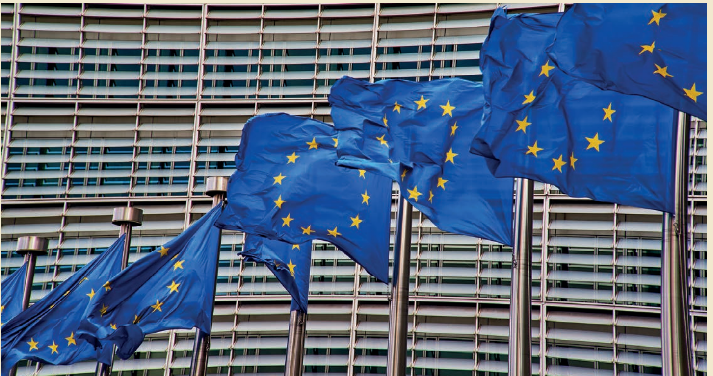
DER MERCOSUR-DEAL MIT DER EUROPÄISCHEN UNION TRITT VORLÄUFIG IN KRAFT.

Aus den Mercosur-Staaten sollen vor allem Rindfleisch, Geflügel, Reis, Honig, Eier, Ethanol, Zitrusfrüchte und Zucker mit stark gesenkten Zöllen importiert werden. Europäische Landwirte befürchten Wett-