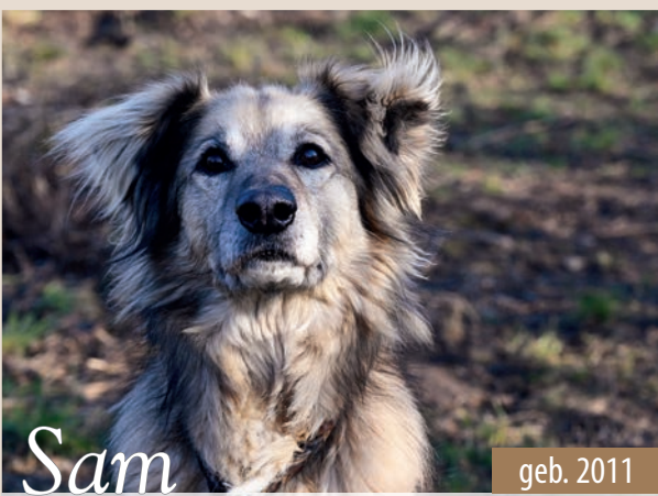
Sam geb. 2011

Der Kangal-Maremma-Abuzzen-Mix ist ruhig und ausgeglichen, rassetypisch wachsam, loyal und sehr selbstständig. Seinen Bezugspersonen gegenüber zeigt er sich verschmust und anhänglich. Leo geht gut an der Leine, würde aber fremde Hunde anpöbeln, wenn dieses Verhalten nicht konsequent unterbunden wird. Nach Eingewöhnung kann er mehrere Stunden allein bleiben. ID V94112