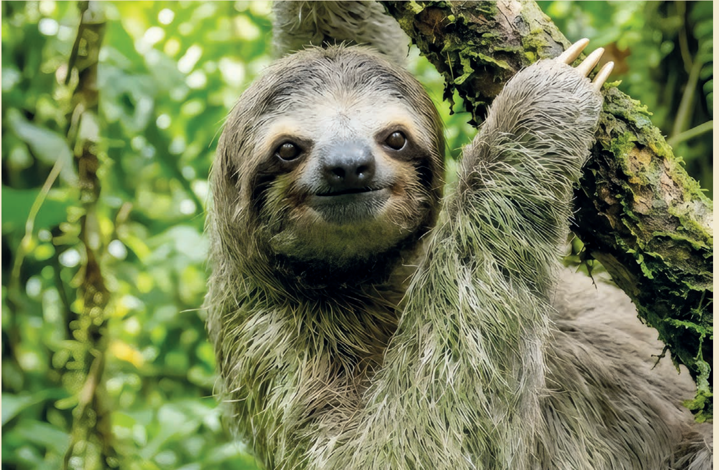
AUCH FAULTIERE LEBEN IM AMAZONAS-REGENWALD.

63 Prozent in der EU nicht zugelassen sind. Die Pestizide werden in den südamerikanischen Staaten zudem oft mit Kleinflugzeugen ausgebracht, so dass die Verteilung gefährlich ungenau ist.