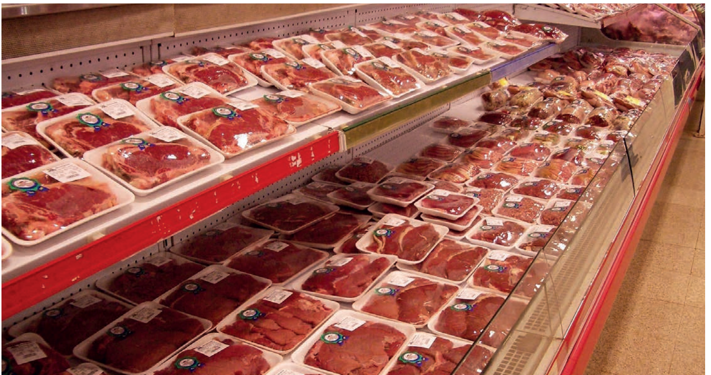
IST DAS EXPORTFLEISCH UNBEDENKLICH?

Brasilien hat nach Indien den zweitgrößten Bestand an Rindvieh. 2 In diesem Land gibt es mehr Rinder als Menschen. Insgesamt können gemäß Abkommen 99.000 Tonnen Rindfleisch mit einem verminderten Zollsatz von 7,5 Prozent aus den Mercosur-