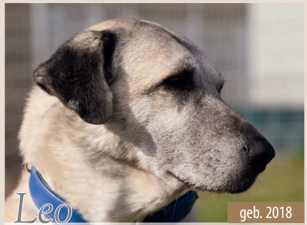
Leo geb. 2018

Manfred ist freundlich und agil. Bei Fremden zeigt er sich zunächst misstrauisch, ist aber gut zugänglich. Er braucht etwas Zeit, um richtig aufzutauen und Vertrauen zu fassen. Hat er dieses gewonnen, blüht er auf und zeigt sich anhänglich, verschmust und unternehmungslustig. Auch den Umgang mit Artgenossen und Umweltreizen kennt er bereits. ID V94952