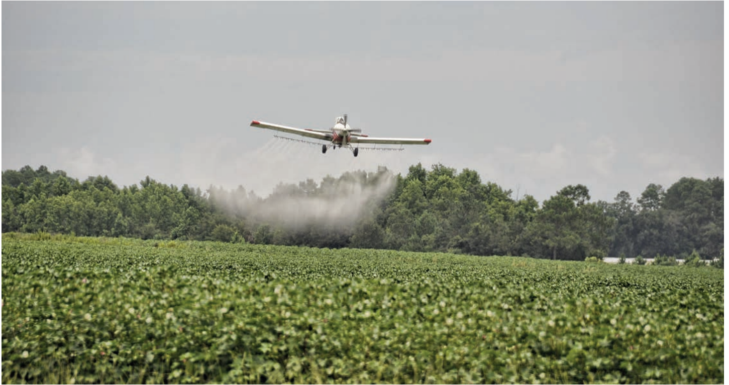
IN SÜDAMERIKA WERDEN PESTIZIDE EINGESETZT, DIE IN EUROPA SCHON LANGE VERBOTEN SIND.

Staaten in die EU exportiert werden. Aktuell machen die Importe rund 3,9 Prozent des Rindfleischverbrauchs in Europa aus, durch das Abkommen werden geschätzt 1 bis 1,2 Prozent hinzukommen. Die Rinderfarmen Brasiliens sind teils größer als Großstädte, die größte industrielle Mastanlage (Feedlot: Grande Lago) hat Platz für 85.000 Rinder. Hier gibt es automatisierte Fütterungs- und Managementsysteme, Tierwohl-Standards werden eingehalten mit internationalen Zertifizierungen, liefert dieser Feedlot Rindfleisch für den nationalen Markt und für den Export. 3