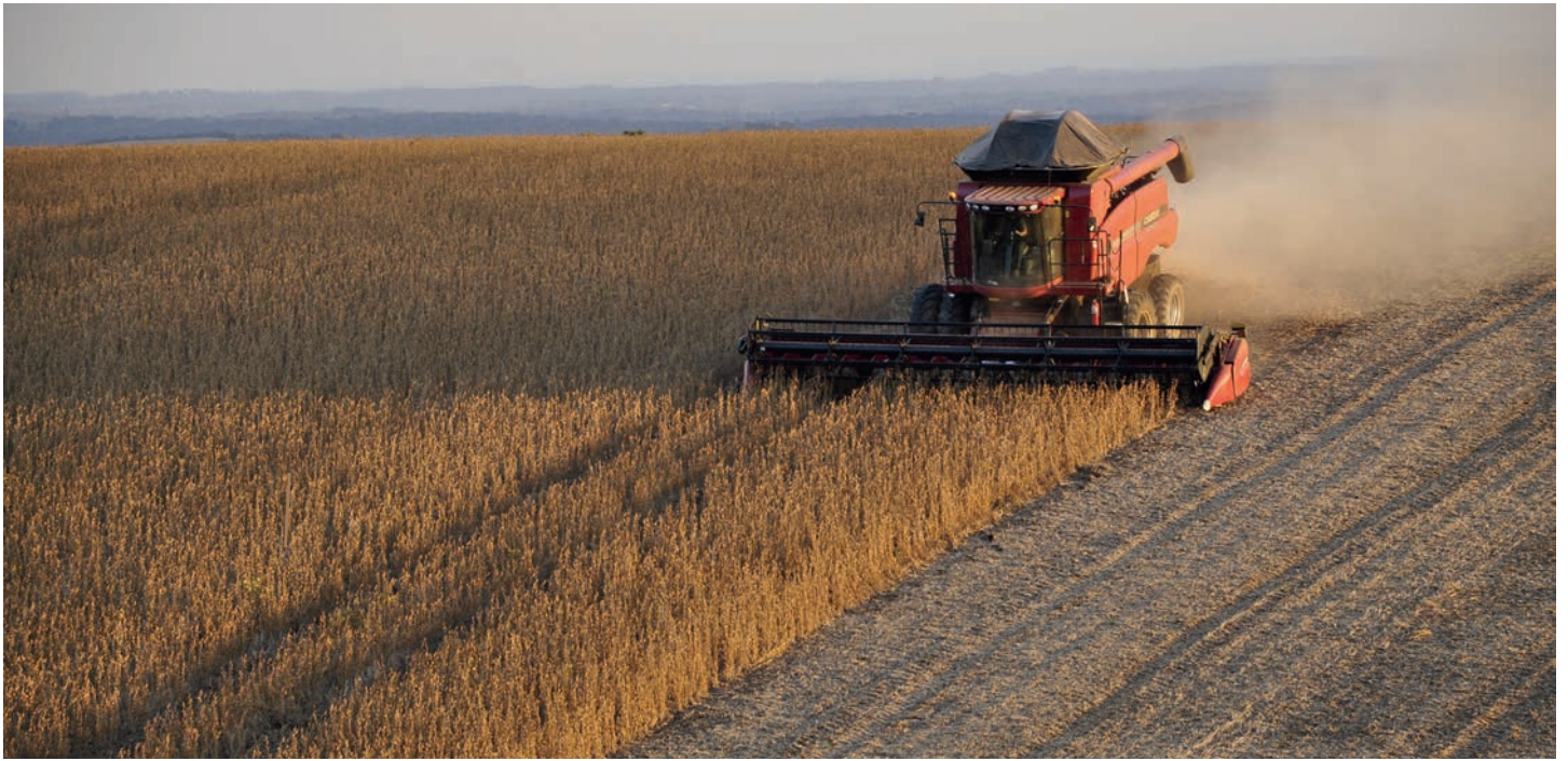
UM ANBAUFLÄCHEN ZU VERGRÖßERN, WIRD REGENWALD ZERSTÖRT.

Der mit Abstand größte globale Entwaldungstreiber ist dabei die Ausweitung landwirtschaftlicher Nutzflächen: Fast 90 Prozent der weltweiten Waldzerstörung ist auf diesen Faktor zurückzuführen, die Nachfrage nach landwirtschaftlichen Produkten wie etwa Fleisch, Palmöl, Soja oder Kaffee ist also direkt verknüpft mit der Entwaldung von tropischen Gebieten. 11 Werden tropische Wälder durch Brandrodung vernichtet, wird der in der Biomasse gespeicherte Kohlenstoff in Form von CO 2 freigesetzt. Der weltweite tropische Waldverlust aus 2023 verursachte ganze 2,4 Gigatonnen CO 2 – das entspricht etwa der Hälfte der Emissionen, die in den USA jährlich durch fossile Brennstoffe verursacht werden. Die illegale Rodung und Abholzung geht zwar seit dem Ende der Amtszeit von Präsident Bolsonaro 2023 zurück, aber Umweltschutzorganisationen wie Greenpeace vermuten, dass die Rodung des Regenwaldes durch das Mercosur-Abkommen wieder größere Ausmaße annehmen wird, um mehr Anbau- und Weidefläche zu schaffen.