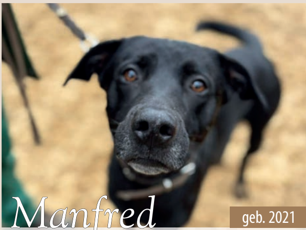
Manfred geb. 2021

Sie ist aktuell noch etwas schreckhaft. Vermittelt wird sie in Innen- oder Außenhaltung, zu einem passenden Partnertier. ID V95264