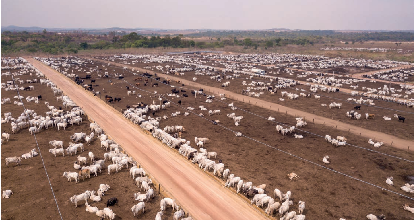
DIE RINDERHERDEN IN DEN MERCOSUR-STÄTTEN ZÄHLEN OFT VIELE TAUSEND TIERE.

bewerbsnachteile, Umweltschützer sehen unter anderem Gefahren durch eine noch stärkere Abholzung des Regenwaldes, Verbraucherschützer blicken mit Argwohn auf den in den südamerikanischen Staaten üblichen starken Einsatz von Pestiziden, von denen viele im europäischen Raum schon lange verboten sind.