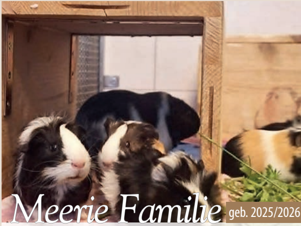
Meerie Familie geb. 2025/2026

Es handelt sich um zwei Mütter mit je drei Jungtieren. Die Meeries sind zwar neugierig, aber sehr schreckhaft. Vermittelt werden sie entweder zu bereits vorhandenen Artgenossen, als Pärchen oder kleine Gruppe. Sie kennen nur die Innenhaltung. Die männlichen Tiere sind kastriert.