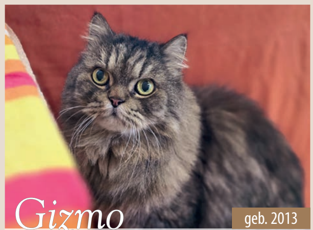
Gizmo geb. 2013

Unser Senior Sam braucht einen Moment, um mit Fremden warm zu werden, sobald das geschafft ist, taut der Rüde auf und ist ein lustiger Begleiter. Der hübsche Kerl kann gut allein bleiben und ist stuberein. Er hat einen guten Grundgehorsam und ist bei Spaziergängen ein angenehmer Weggefährte. ID V81380