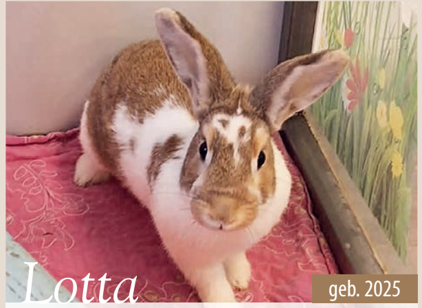
Lotta geb. 2025

Es handelt sich um zwei Mütter mit je drei Jungtieren. Die Meeries sind zwar neugierig, aber sehr schreckhaft. Vermittelt werden sie entweder zu bereits vorhandenen Artgenossen, als Pärchen oder kleine Gruppe. Sie kennen nur die Innenhaltung. Die männlichen Tiere sind kastriert.